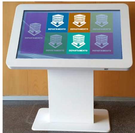
Atril 32 " / 49 "

Los soportes que ofrecemos se presenta en dos modelos y dos medidas: