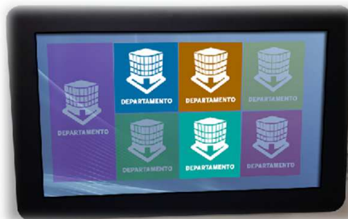
Pantalla Pared 32 " / 49 "

i-Touch se comercializa en régimen de alquiler por lo que nuestros clientes solo se tienen que preocupar de documentar el software y de tenerlo actualizado, del resto nos encargamos nosotros.